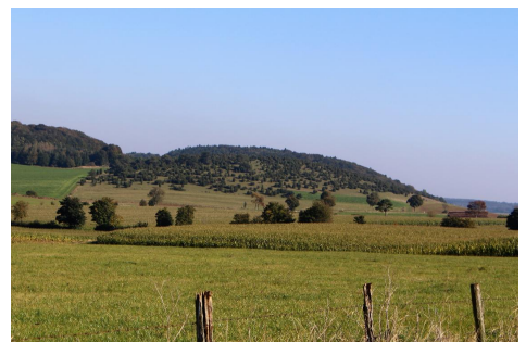
Blick zum Naturschutzgebiet